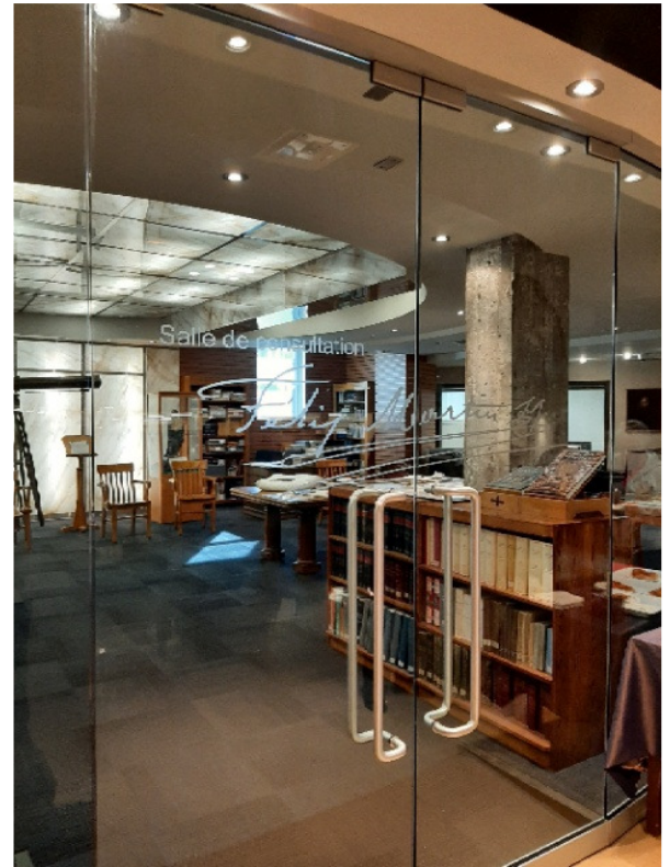
Salle de consultation